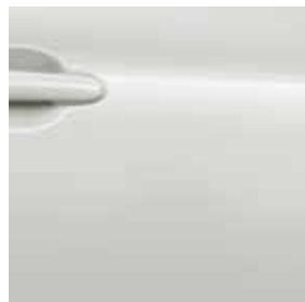
Màu trắng ngọc trai (3P) – QAB