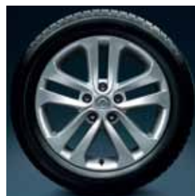
Mâm đúc 17-inch