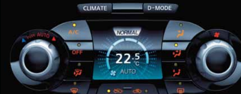
Hiển thị trên giao diện CLIMATE

Nhân tố kép. Ngoài phong cách lái xe, hệ thống điều khiển tích hợp của Nissan giúp bạn điều chỉnh sự thoải mái bên trong nội thất. Đơn giản bằng cách chuyển đổi từ chế độ D-Mode sang chế độ Climate, và màn hình chuyển sang hiển thị tất cả các lựa chọn mà bạn cần để làm cho khoang lái trở nên ấm áp hay mát mẻ như bạn muốn.