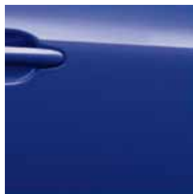
Màu xanh dương (PM) – RBN

(3P): Ngọc trai 3 lớp (M): Ảnh kim (P): Ngọc Trai (PM): Ngọc trai ảnh kim