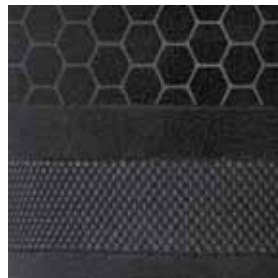
Nỉ đen cao cấp