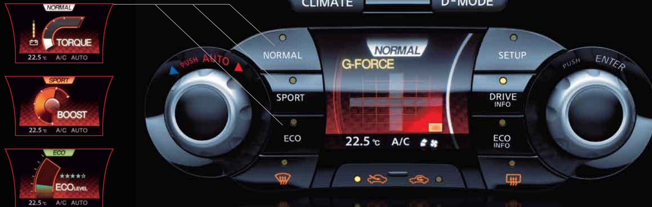
Hiển thị trên giao diện D-MODE

Chuyên gia về hiệu suất. Tùy chọn chế độ thường, chế độ thể thao hay chế độ tiết kiệm ngay khi bạn muốn.